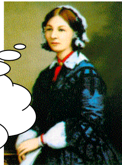
フローレンス・ナイチンゲール